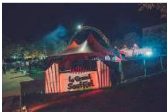
Le Chapiteau du Village Thabor