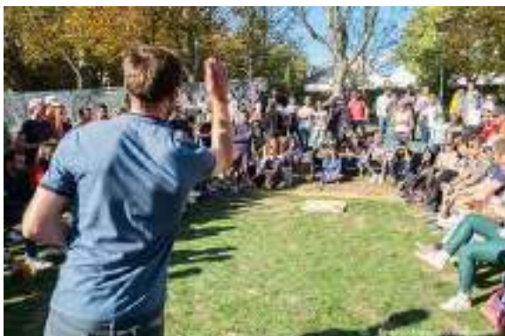
Le tournoi du Grand Palet (un jeu traditionnel breton)