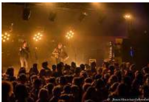
Un concert dans le Chapiteau