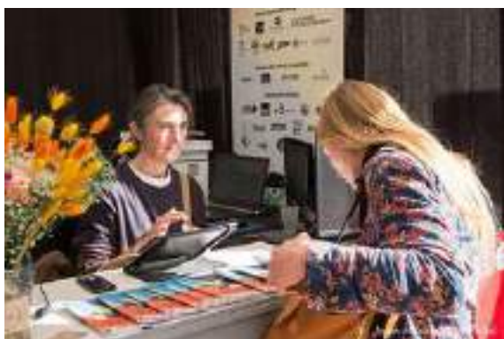
L'accueil : informations et billetterie