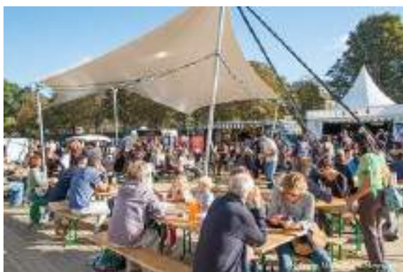
La Guinguette du Village Thabor

On peut y jouer, danser, voir des concerts gratuits, boire et manger :