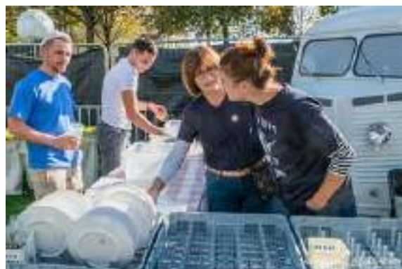
L'espace vaisselle participative avec les bénévoles