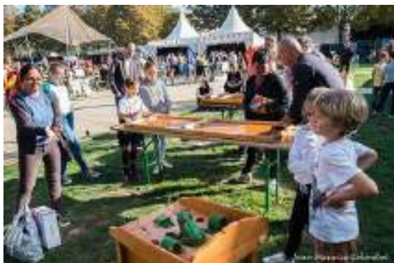
Les jeux pour enfants