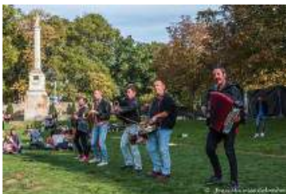
Un concert gratuit sur la Guinguette