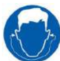
Des bouchons d'oreille