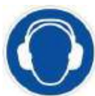
Des casques de protection auditive

Des dispositifs de prévention sont disponibles à l'accueil :