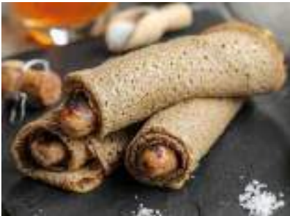
Des galettes saucisses